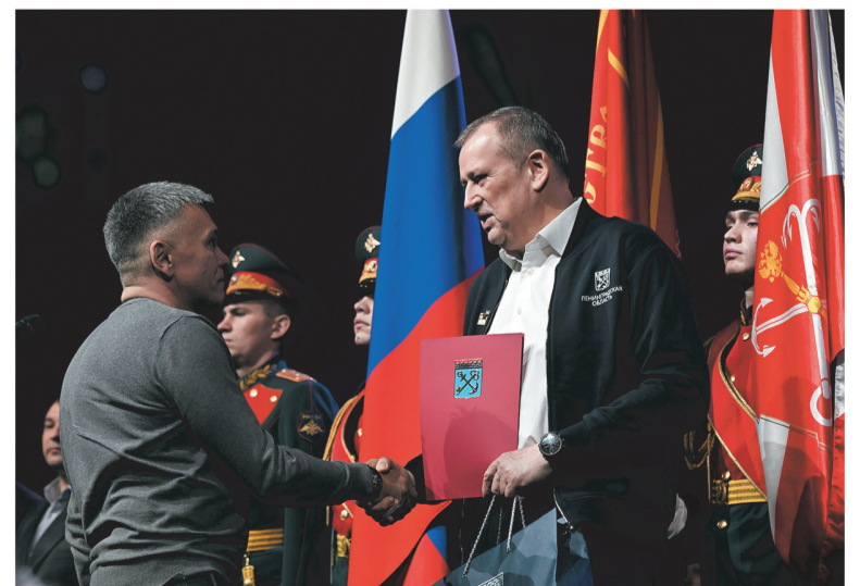
Александр Дрозденко наградил участников боевых действий и восстановления Донбасса