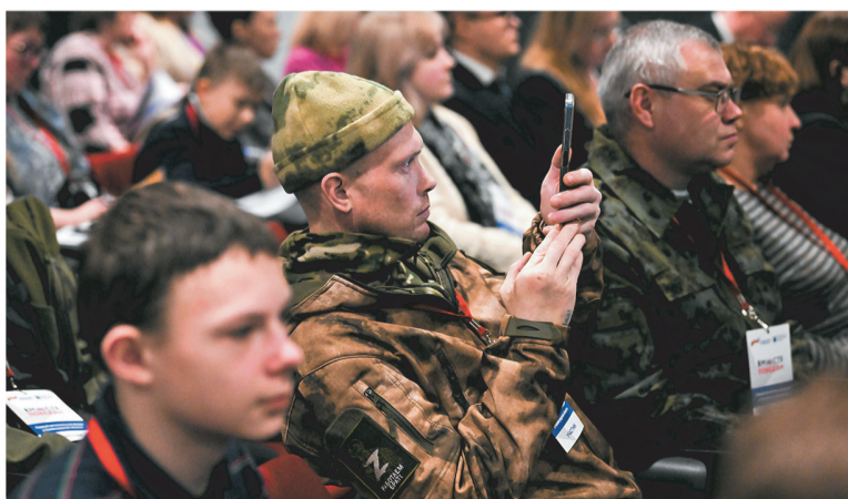
Участие в форуме приняли ветераны СВО, военные корреспонденты и волонтеры