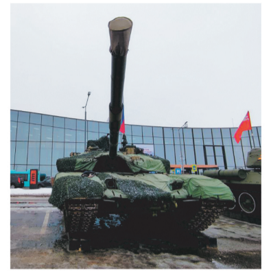
Гостей ждала выставка боевой техники

Центральным событием фестиваля стал первый региональный форум «Вместе победим». Его участниками стали ветераны СВО и родственники бойцов.