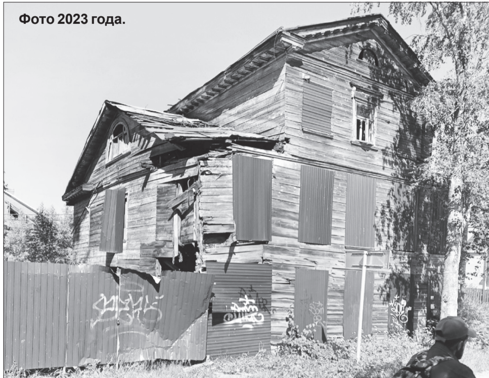
Фото 2023 года.

дения противоаварийных мероприятий на мосту через Введенский ручей на улице Зайцева (выделено более 18 млн рублей) и на ремонт участка социально значимой дороги по улице Ленинградской — от моста через Введенский ручей до подъезда № 2 к Тихвину (без малого 38 млн рублей, включая местное софинансирование в размере 1,76 млн).