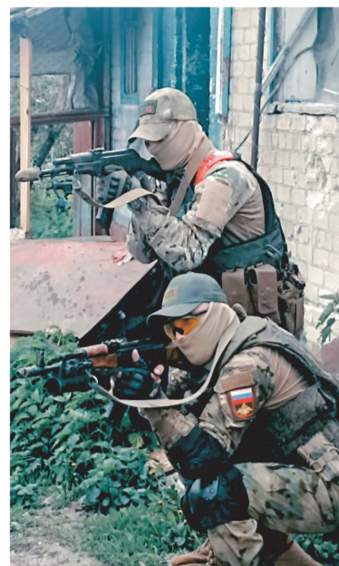
Волевые качества пригодились бойцу на фронте