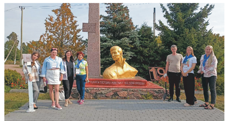
Жители Плодового обустроили территорию вокруг памятника неизвестному солдату