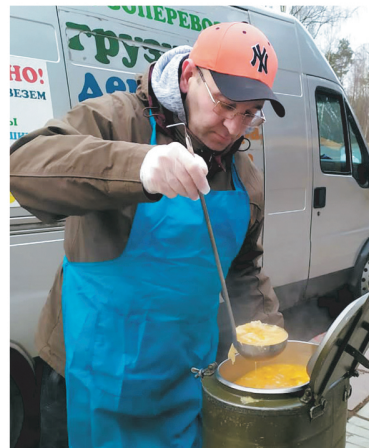
Волонтеры «Пятого угла» кормят бездомных

годня», направленный на сохранение памяти о героях Великой Отечественной войны. Всё началось с небольшой патриотической акции в посёлке Плодовое Приозерского района. Местные добровольцы вместе со школьни-