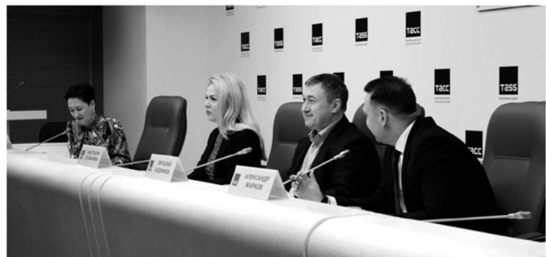
Пресс-конференция фонда «Ленинградский рубеж» о планах на 2024 год