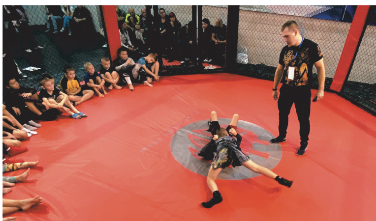
В Выборге спортсмены передают свой опыт подрастающему поколению