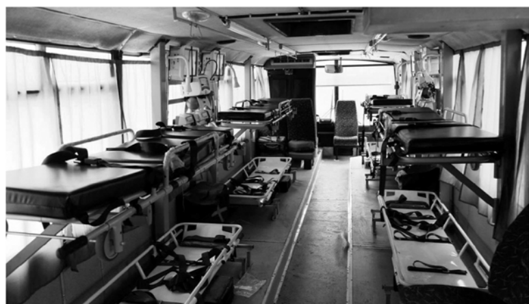
Уникальный реанимационный автобус для нужд фронта

Совместный проект фонда «Ленинградский рубеж» и Комтранса Ленобласти по модернизации гражданского транспорта