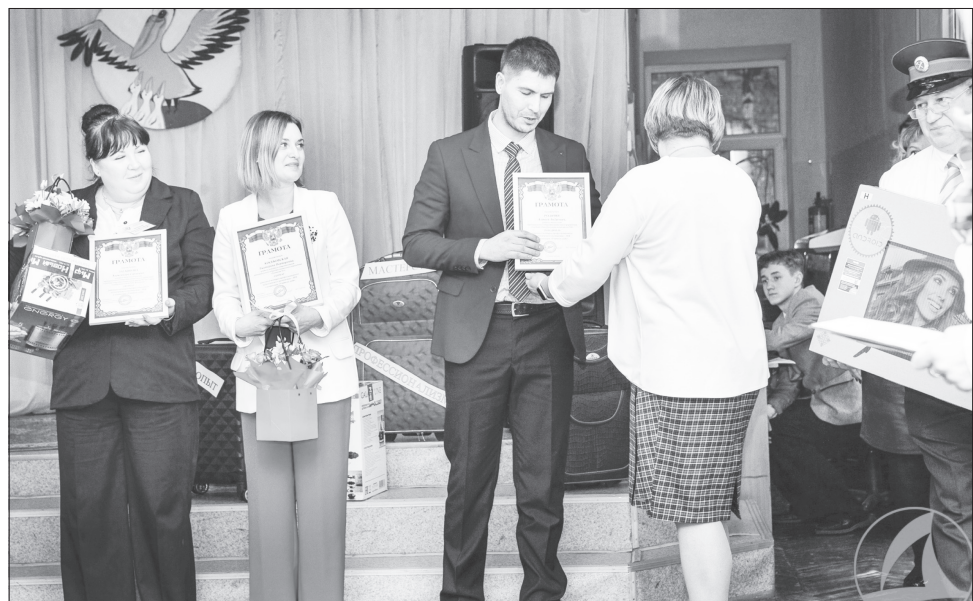
Лауреаты и победитель конкурса «Учитель года».

часа в сутки, огромное вложение сил, напряженная борьба на всех этапах. При подготовке к конкурсу у меня появилась возможность осмыслить то, чего уже смог достичь, куда хотел бы двигаться в своей профессиональной деятельности.