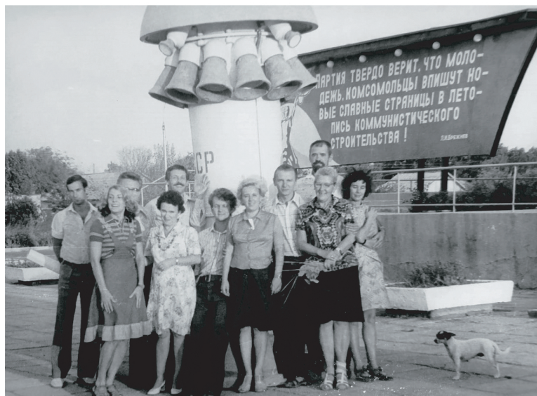
Константин Петров вписал своё имя в историю советского ракетостроения