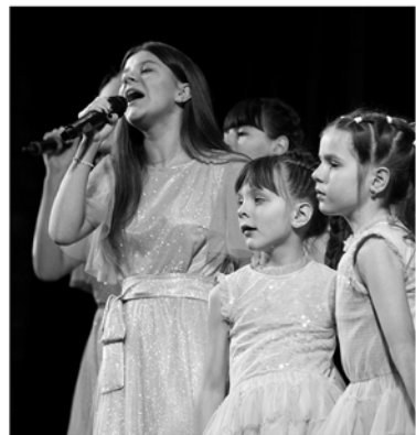
Концерт юных талантов Донбасса и Ленобласти

Помимо медицинской и социальной поддержки фонд «Ленинградский рубеж» не забывает и про образовательную составляющую. В течение прошлого года на передовой работали классы обучения на сварщиков в интересах наших ремонтных батальонов. Преподавателей сварочного мастерства из областных вузов пригласили в командировку на полтора-два месяца в зону СВО. Задача стояла непростая: превратить трёхлетний курс подготовки в интенсив на полтора-два месяца. Всё получилось. Ребят обучили, снабдили всем необходимым — так рембат получил новые рабочие руки!