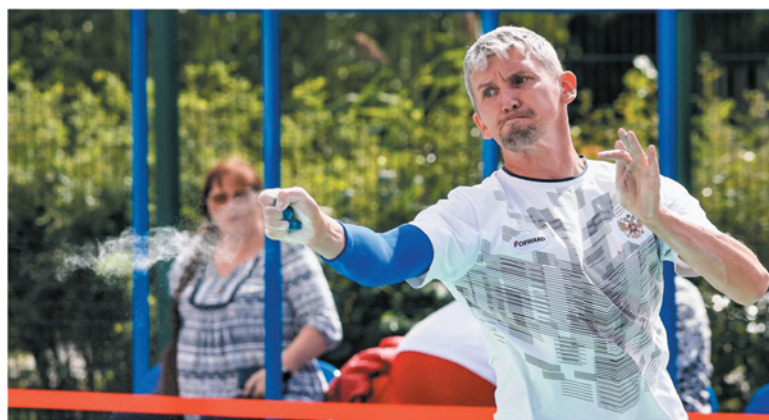
Чемпионат Европы по городошному спорту объединил атлетов из разных стран

— Подготовка профессиональных спортсменов начинается со спортивных школ, где