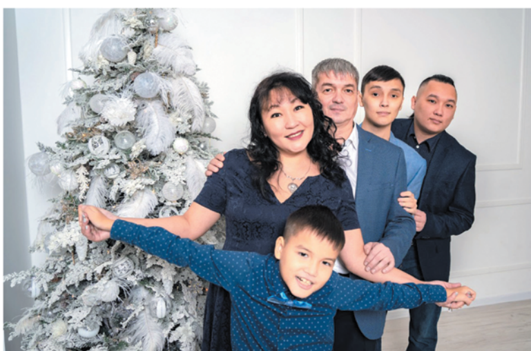
Хранители педагогических традиций — семья Юзвик из Мурино

АЛЕКСЕЙ АСТАПЧИК