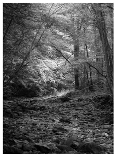
■ Рагуша, Бокситогорский район

Общая протяжённость маршрута «Мыс Киперорт» составляет 19 километров. Тропа проложена по двум берегам Киперорта — самого крупного полуострова в Выборгском заливе. Маршрут проходит по западному каменистому берегу полуострова и восточному — песчаному. Здесь можно увидеть различные типы лесов, а также остатки фортификационных сооружений времён Второй мировой войны. О местных флоре и фауне можно узнать с помощью эколого-просветительских щитов, снабжённых картами. Для удобства посетителей обустроены парковочное пространство, туалеты и столбы дополнительной разметки.