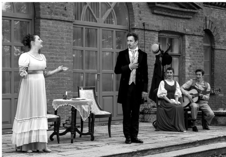
Усадьбы и замки Ленобласти становятся декорациями для постановок театра

театра» мы включили многие аспекты и направления, сферы бытия театра.