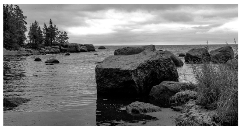
■ Каменистая тропа, Выборгский район

На сегодняшний день все 47 экологических маршрутов, заявленных в проекте «Тропа47», введены. Далее мы будем поддерживать в рабочем состоянии уже построенную инфраструктуру, создавать комбинированные маршруты, чтобы была возможность на одной территории, в зависимости от уровня подготовки, пройти более длинные расстояния. Для снижения антропогенной нагрузки очень нужны организованные стоянки, информационные щиты и другая полезная инфраструктура.