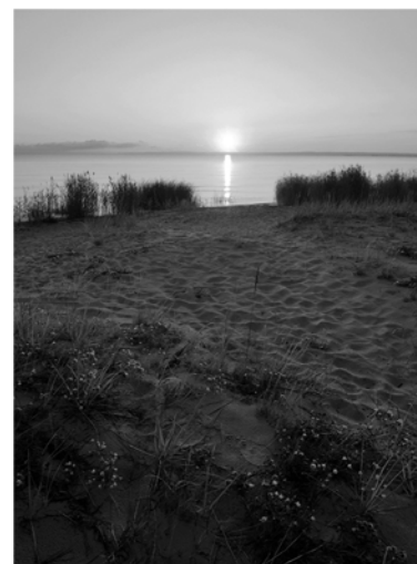
■ Выбья, Кингисеппский район

Мы же решили рассказать читателям «Ленинградской панорамы» о семи необычных экотропах в разных уголках Ленобласти, построенных за последние годы.