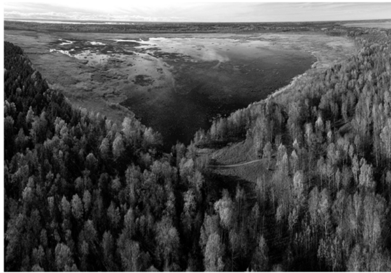
■ Раковые озёра, Выборгский район