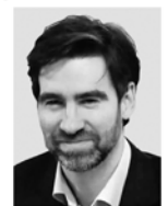
ДМИТРИЙ ЯЛОВ, ЗАМПРЕД ПРАВИТЕЛЬСТВА ЛЕНИНГРАДСКОЙ ОБЛАСТИ, ПРЕДСЕДАТЕЛЬ КОМИТЕТА ЭКОНОМИЧЕСКОГО РАЗВИТИЯ И ИНВЕСТИЦИОННОЙ ДЕЯТЕЛЬНОСТИ

Задача властей Ленобласти — предложить максимально качественные условия для туристов, чтобы не разочаровать путешественников, заручиться их лояльностью и рассчитывать на возвращение.