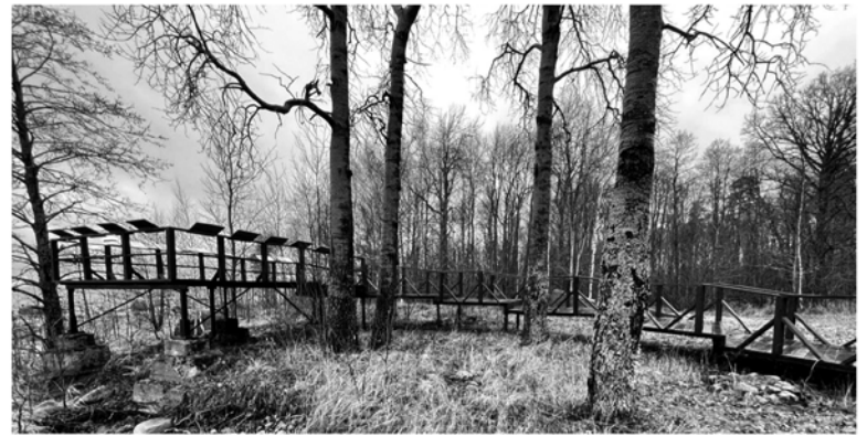
■ Мыс Кипперорт, Выборгский район

Почти треть тропы оборудована настилами и мости-