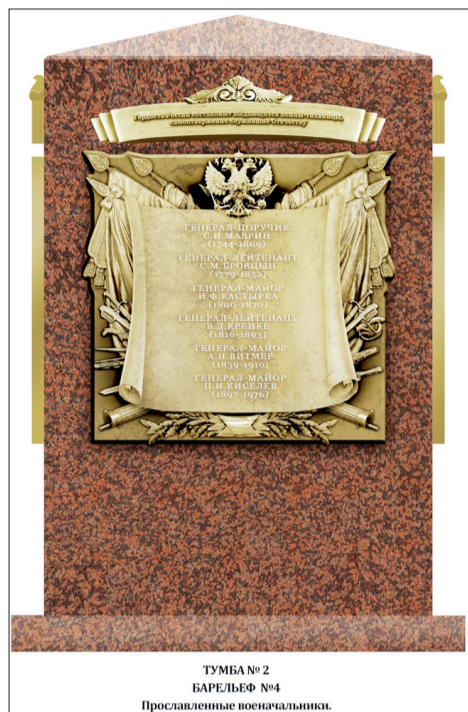
ТУМБА № 2 БАРЕЛЬЕФ №4 Прозлавленные военачальники.

– упразднённый Николо-Беседный монастырь по предписанию Святейшего Синода от 14 июля 1774 г. воссоздан с прежними владениями, кроме крестьянских деревень, и ему назначено столько земли, сколько он сможет обрабатывать; – 5 мая 1774 г. С.И.Маврин и его сослуживцы начали проводить допросы ближайших сподвижников Пугачёва и рядовых повстанцев. 21 мая Маврин отправил в Петербург донесение, в котором отважился утверждать, что восстание было вызвано бедственным положением народа. С.И.Маврин арестовал Емельяна Пугачёва в Яицком городке. В деле Пугачёва материалы допросов, проведенных Мавриным, наиболее откровенны и достоверны. А.С.Пушкин писал о Маврине: «Арестовавший Пугачёва, замечательный