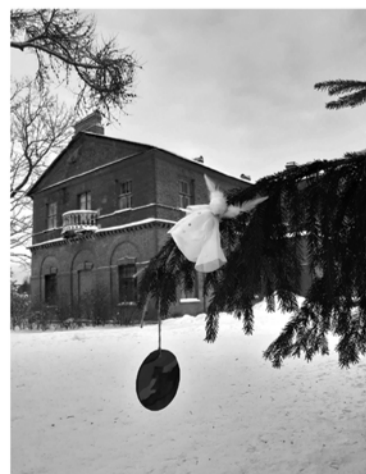
Усадьба «Приютино» во Всеволожском районе