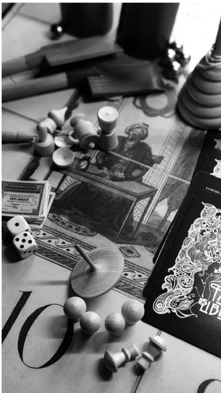
Сыграть в дворянские настольные игры смогут гости Кингисеппа