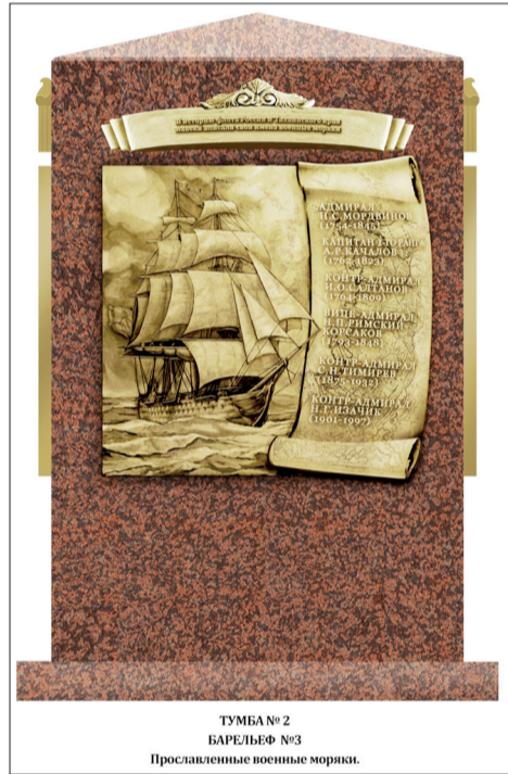
ТУМБА № 2 БАРЕЛЬЕФ №3 Прозлавленные военные моряки.

честностью военный интендант», «отличался умеренностью и благоразумием».