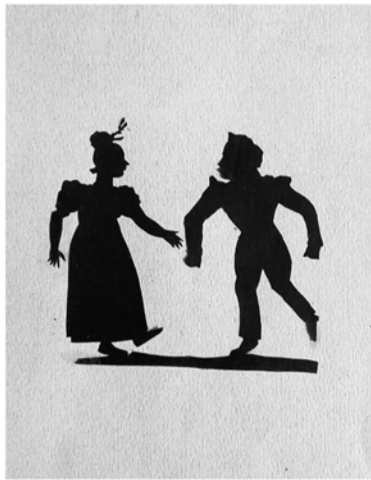
Вырезаем силуэты в Доме-музее Римского-Корсакова

МУЗЕЙНОЕ АГЕНТСТВО ПРОВОДИТ ФЕСТИВАЛЬ «КАНИКУЛЫ В ЛЕНИНГРАДСКОЙ ОБЛАСТИ»