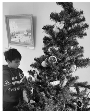
Украшаем ёлку в Тосненском музее

Провести настоящее музейное расследование и, узнать, откуда пришла традиция украшать ёлку, предлагают в Тосненском историко-краеведческом музее — единственном в России музее, посвящённом забытому промыслу кормилиц. Посетители также смогут самостоятельно украсить одну из душистых хвойных красавиц, которыми исторически славятся леса Тосненского района.