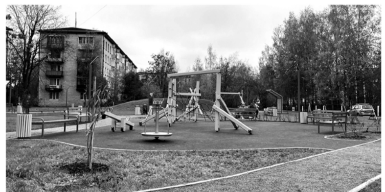
В Лаголово учли особенности рельефа и сохранили любимую всеми горку

«Китайский сад» стал местом, где жители Ропши и гости посёлка могут насладиться природой, послушать пение птиц и журчание воды. На территории расположены два арт-объекта. Арт-объект «Камни» — символизируют камешки, брошенные в реку. Арт-объект «Зеркало природы» — призван привлечь внимание подрастающего поколения