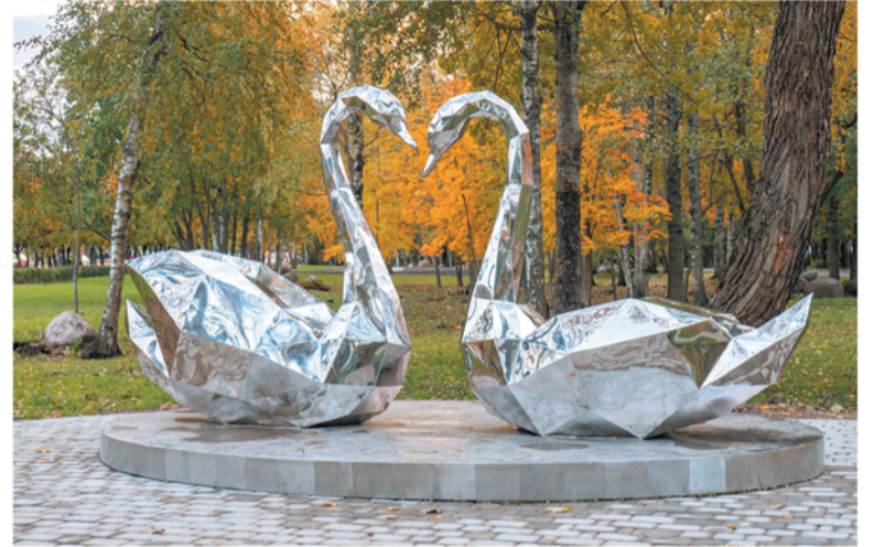
Серебряные лебеди из Соснового Бора

— В Ленобласти вовлекают в процесс благоустройства не