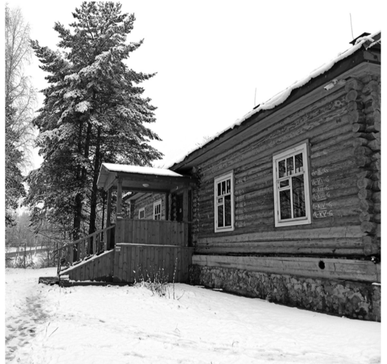
Музей «Астрача, 1941» приглашает гостей на семейную игротку

Узнать, как отмечали Рождество в старинной усадьбе, приглашает музей «Приютино», расположенный неподалеку от Петербурга. 5 и 6 января в старинном доме, принадлежавшем семье Алексея Николаевича Оленина, можно будет сыграть в игру «Правда или вымысел», выяснить, чем рождественские традиции отличаются от традиций празднования Нового года, сделать самим игрушку «дергунчик» и оставить ее на память о посещении усадьбы. А заодно познакомится ближе с историей Волховского района.