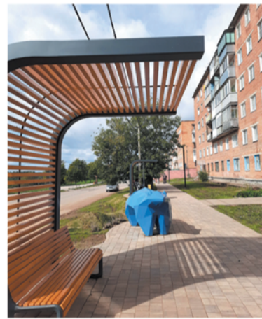
Такой синий мишка поселился в Пикалево

БЕСЕДОВАЛА МАРИЯ КОМАРОВА