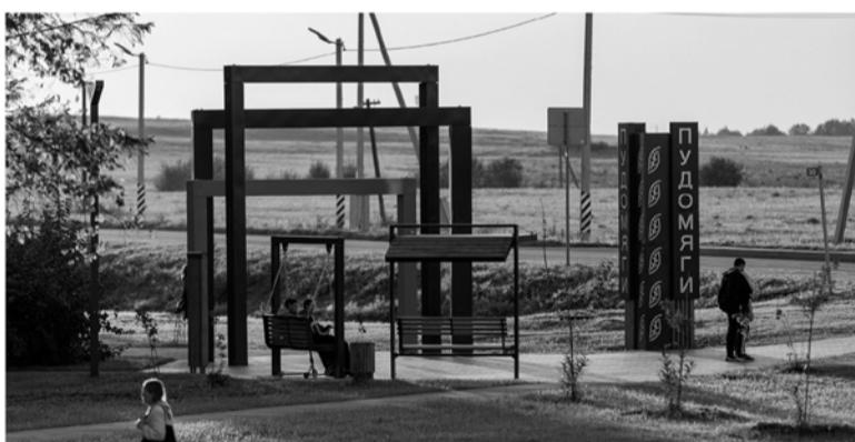
Новый сквер в Пудомьягах изменил внешний вид деревни

ТРИ ЯРКИХ ПРИМЕРА «ПЕРЕЗАГРУЗКИ» ПОСЕЛЕНИЙ ЛЕНОБЛАСТИ В 2023 ГОДУ