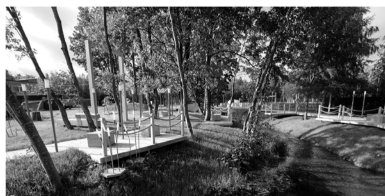
«Китайский сад» в Ропше напоминает про связь человека с природой

■ Общественное пространство «Китайский сад» в Ропше Целью проекта стало сохранение природных и ландшафтных особенностей территории (камни-валуны, деревья, холмы) и естественное включение их в необходимую для современного жителя инфраструктуру. В саду