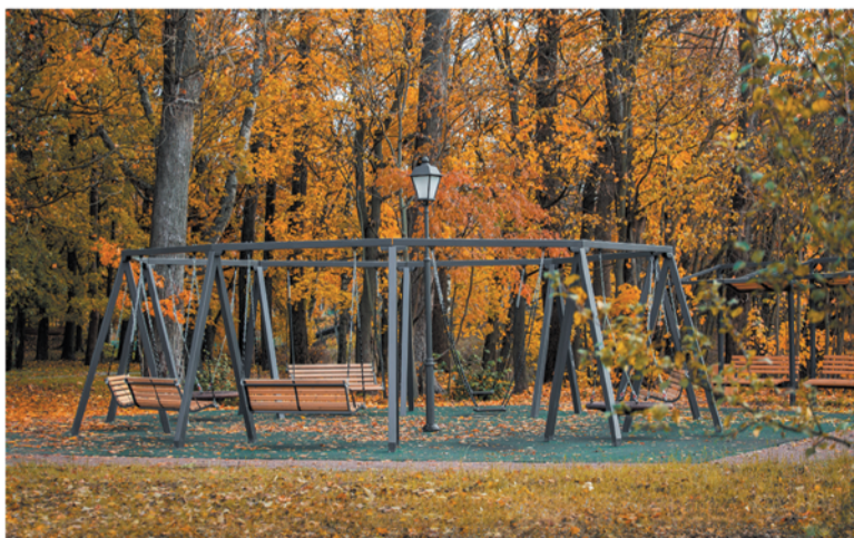
В Шлиссельбурге появились новые места для семейного отдыха

защиту. Благодаря победе и софинансированию от региона в Пикалево, например, появился парк «Зелёный квадрат». В парке обустроены современная площадка для ярмарок, эко-тропа для скандинавской ходьбы, живописный спуск к реке Рядань, сцена с местами для зрителей и детские игровые площадки. В Шлиссельбурге по проекту «45 ключей к одному ключ-городу» завершаются работы, которые дадут новую жизнь историческому центру. Площадь у Благовещенского собора, парк Гагарина, бульвар Первого мая образуют единый пеше-