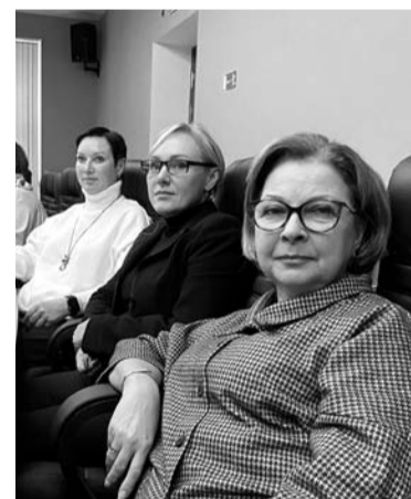
У заботы — женское лицо

— Спасают от выгорания и такие прекрасные образовательные программы. Для нас всех это отличная перенастройка сознания. Мы здесь перезнакомились, узнали новые практики. А самое главное, поняли — каждый руководитель решает одинаковые во-