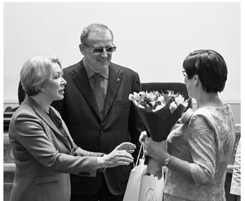
На форуме вручили награды выдающимся женщинам Ленобласти

АЛЕКСЕЙ АСТАПЧИК