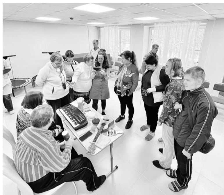
Кировский ПНИ проводит творческие мероприятия для получателей социальных услуг

Год назад стартовал образовательный проект «Область заботы 2.0: Профессиональное развитие Команды 47 в социосфере». Специальные курсы при поддержке правительства Ленинградской области и РАНХиГС прошли руководители и сотрудники государственных социальных учреждений. Параллельно с учёбой они на практике занимались внедрением социальных инноваций на местах. О том, что получилось, — рассказали на итоговом собрании проекта.