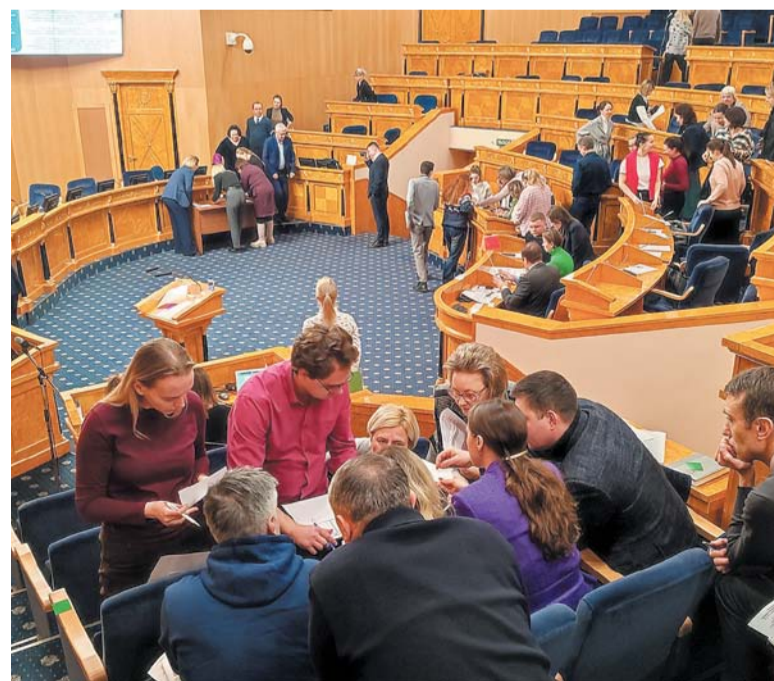
Участники семинара закрепили полученные знания в игровом формате

КСЕНИЯ БОНДАРЕНКО