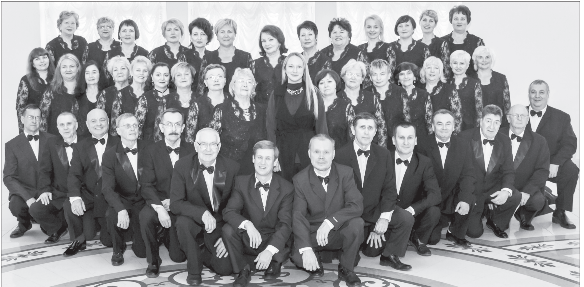
Фото хора – из архива редакции.