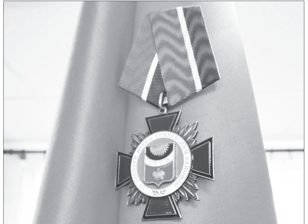
Почетный знак «За заслуги перед Тихвинским районом» на знамени организации.