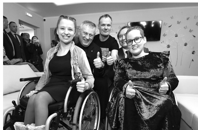
Социальный кодекс Ленинградской области предполагает всестороннюю поддержку людей с ОВЗ

Всего же адаптированными к формату безбарьерной среды в регионе считаются 1625 объектов. Узнать о них всег-