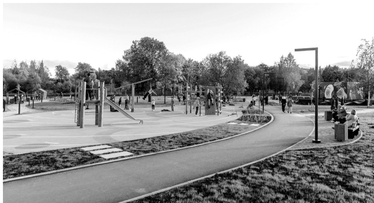
Общественные пространства в Ленобласти строят по правилам доступной среды

да можно на информационной платформе «Карта доступности Ленинградской области. Область без преград», разработанной областным правительством.