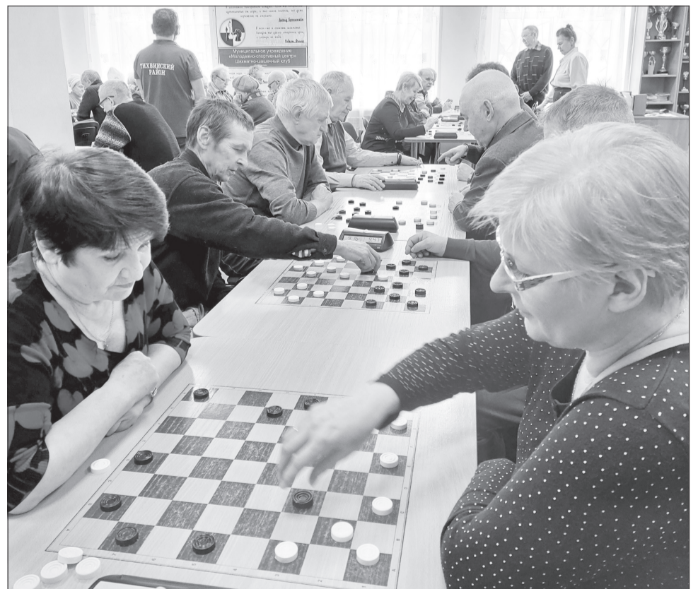
С огромным удовольствием ветераны района участвуют в различных спортивных играх, спартакиадах.