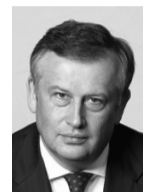
АЛЕКСАНДР ДРОЗДЕНКО, ГУБЕРНАТОР ЛЕНИНГРАДСКОЙ ОБЛАСТИ

Спасибо большое ребятам за участие в конкурсе: благодаря педагогов, классных руководителей и всех тех, кто помогал подготовить конкурсные работы. Ролики наши школьники делают на высоком уровне, видно и мастерство, и неподдельный интерес к теме борьбы с коррупцией