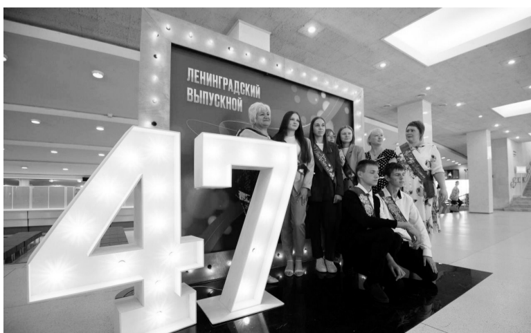
Бал выпускников собрал свыше 3000 молодых ленинградцев

АЛЕКСЕЙ АСТАПЧИК ФОТО: КОМИТЕТ ПО ОБРАЗОВАНИЮ ЛЕНИНГРАДСКОЙ ОБЛАСТИ