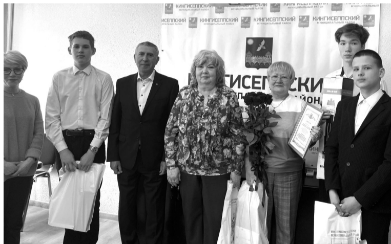
Школьники из Кингисеппы вошли в число победителей

Ролик школьников из Кингисеппы признали самым инновационным. Элементы компьютерной графики старшеклассники создавали своими руками.