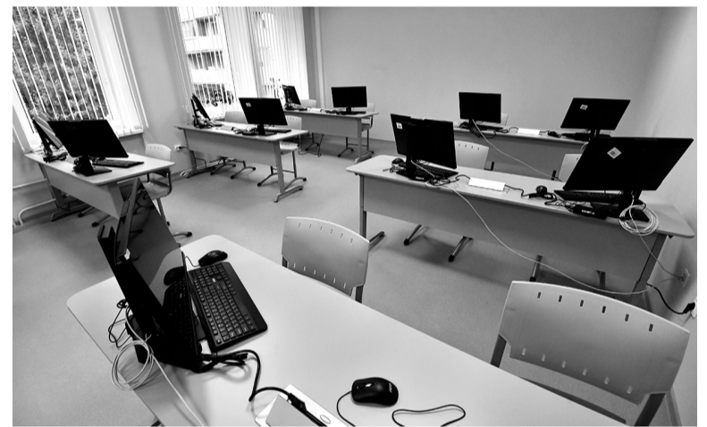
Занятия будут проходить в очном режиме на базе компьютерного класса

АЛЕКСЕЙ АСТАПЧИК ФОТО: МУЛЬТИЦЕНТР СОЦИАЛЬНОЙ И ТРУДОВОЙ ИНТЕГРАЦИИ