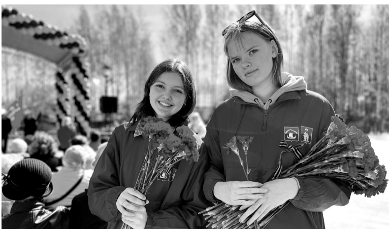
Волонтеры #МыВместе активно участвуют в патриотических мероприятиях

Уже больше года в Ленинградской области действует добровольческое движение #МыВместе. Мы неоднократно писали о том, как волонтеры помогают родным и близким наших защитников — будь то выполнение хозяйственных работ по дому, организация детского праздника или содействие в трудоустройстве. С недавних пор штаб движения определил несколько новых направлений работы. Подробности узнали журналисты «Ленинградской панорамы».