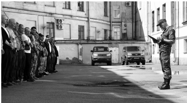
Мероприятие началось с построения и переключки добровольцев

— Уверен, что мои способности хорошего водителя там пригодятся. Знаю о ситуации «за ленточкой» от товарищей, которые уже побывали на фронте. Они, к счастью, вернулись домой живыми и здоровыми. И хотя наша служба, несомненно, связана с риском, я свой выбор сделал. Как говорится, есть такая профессия — Родину защищать, — делится своими мыслями житель Ленинградской области.