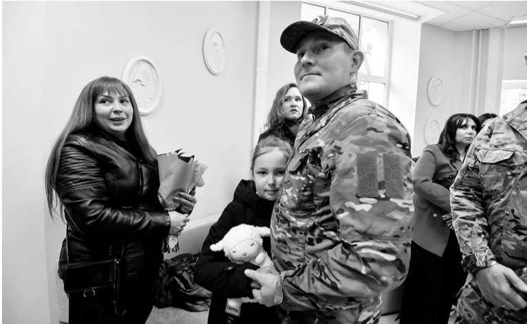
Фонд «Защитники Отечества» поддерживает ветеранов СВО и их семьи

Ленинградский филиал фонда «Защитники Отечества» приглашает бойцов СВО и членов их семей освоить новые специальности: «1С: Склад» и «Компьютерная графика».