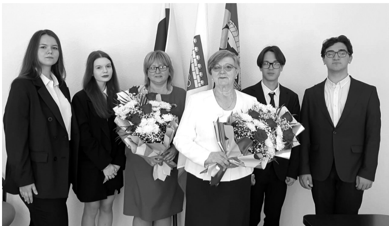
Команда из Луги стала абсолютным победителем конкурса