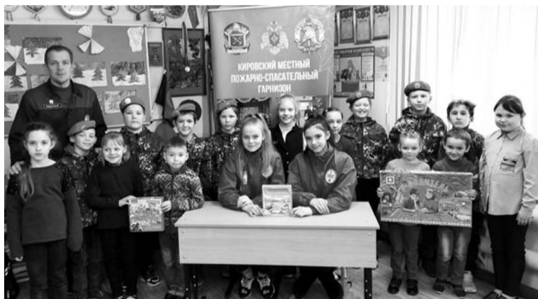
Движение юных пожарных возрождено в России с 2010 года