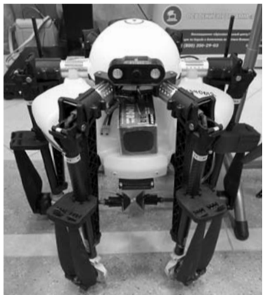
Дроны используют для борьбы с вредителями