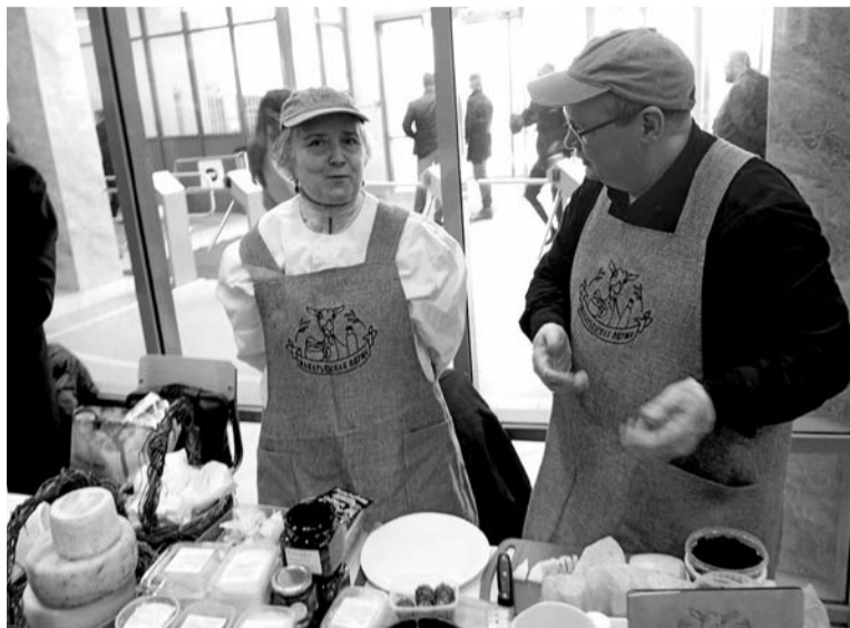
Дегустация продукции стала традицией съезда фермеров

— В рамках контракта жители могут приобрести сельскохозяйственную технику, семена и животных. Сроки рассмотрения заявления очень небольшие — всего месяц. А получить можно