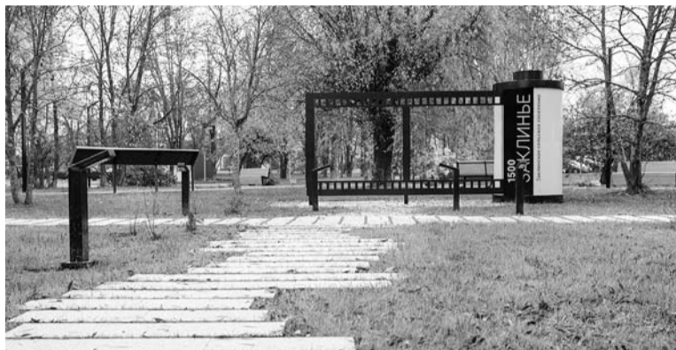
Заклинье. Центральный сквер после благоустройства

Интересное наблюдение: если взглянуть — какие районы голосуют активнее всего, то каждый год картина меняется. В этом году активнее других были жители Бокситогорского, Волховского и Тихвинского районов. А в прошлом лидировали Всеволожский, Гатчинский и Кировский. Возможно, это связано с тем, что жители