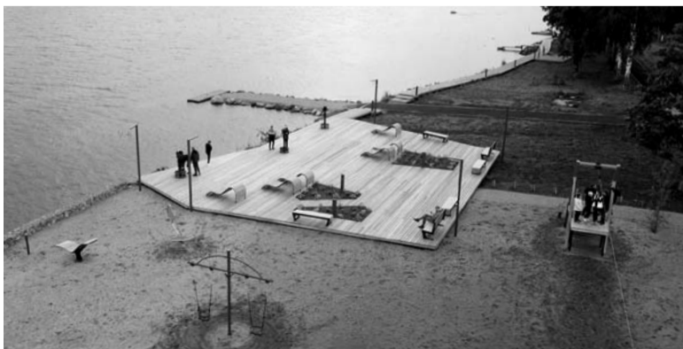
А так выглядит обновлённая Свирская набережная в Вознесенье

Важно отделять идентичность территории от темати-