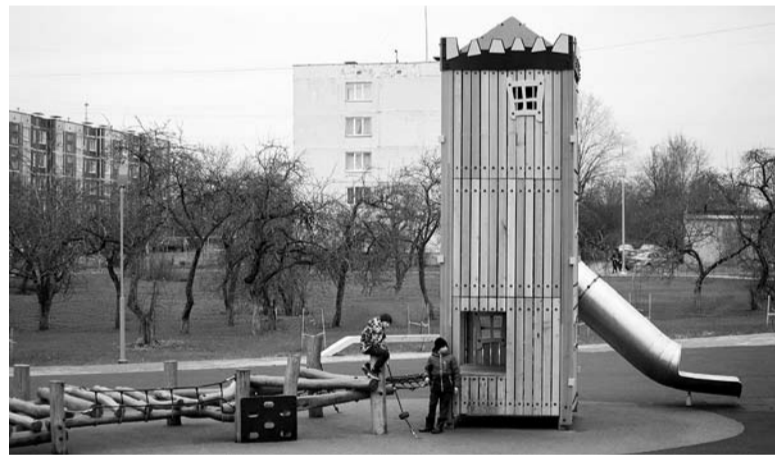
В рамках программы поселения получают новые детские площадки

— Результат всегда зависит от уровня проекта. Важна не только хорошая концепция, но