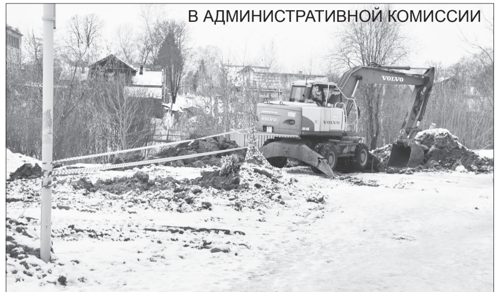
В АДМИНИСТРАТИВНОЙ КОМИССИИ

За этот период он фактически сгорел, и сегодня вся прилегающая территория представляет угрозу для окружающих. К тому же, объект находится в исторической части Тих-