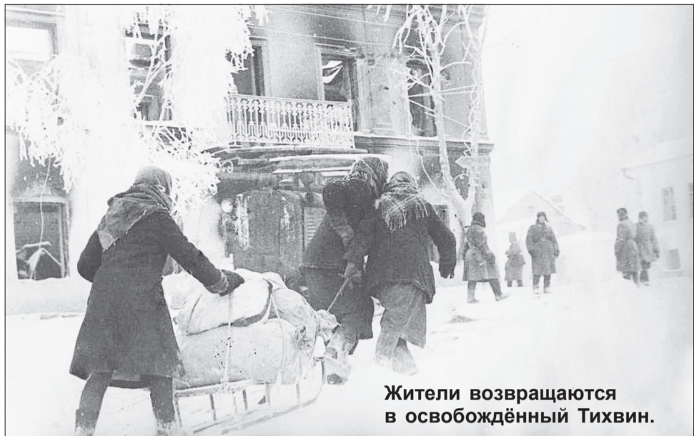
Жители возвращаются в освобожденный Тихвин.

На Чернышевской улице в доме Поповых, от нас через огород, стояли немцы, и я побежала к ним. Был седьмой час вечера, немцы ужинали. Я прибежала и закричала: «Дяденьки, дяденьки маму ранило!». А у самой кровь из ранок у глаза сочится. Немцы молчат, смотрят на меня. На стене в прихо-